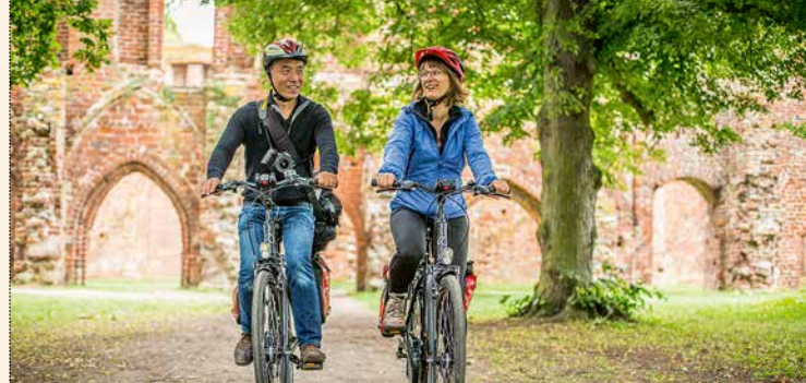
[1] Ruiny Klasztoru Eldena