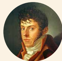
[8] Philipp Otto Runge, Friedrich August von Klinkowström, 1808