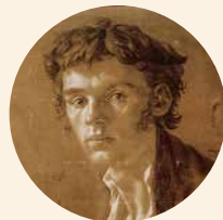
[9] Philipp Otto Runge, autoportret przy stole kreślarskim, 1802 r.