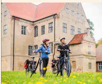
[2] Zamek Ludwigsburg