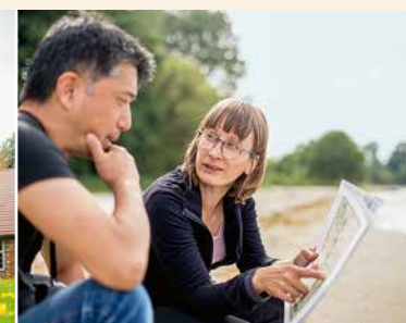
[3] Na plaży w Vierow