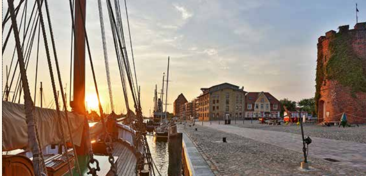
[11] Muzaelny port w Greifswaldzie

Regularne połączenia kolejowe pomiędzy Greifswaldem i Wolgastem gwarantują nieskomplikowany przejazd z możliwością przewozu własnego roweru. Natomiast liczne stacje bezobsługowej wypożyczalni rowerów UsedomRad umożliwiają wygodną podróż.