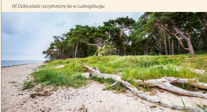
[4] Dzika plaża i przybrzeżny las w Ludwigsburgu