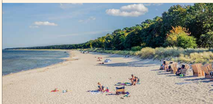
[10] Plaża w Uzdrowisku Lubmin

R Szlak Północnoniemieckiego Romantyzmu opatrzony jest drogowskazami obejmującymi wszystkie punkty wzdłuż szlaku. Tablice informacyjne na wybranych stanowiskach ukazują treści z zakresu historii sztuki i pozwalają zaznaczyć się z ojczyzną romantyzmu.