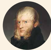
[6] A. Freyberg, Caspar David Friedrich, 1840

*1774 r. w Greifswaldzie †1840 r. w Dreźnie