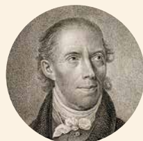
[7] Portret Karla Lappe, 1840 r.

*1774 r. w Greifswaldzie †1840 r. w Dreźnie