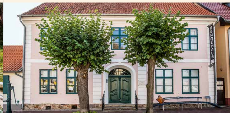
[5] Muzeum Rungehaus w Wolgastie